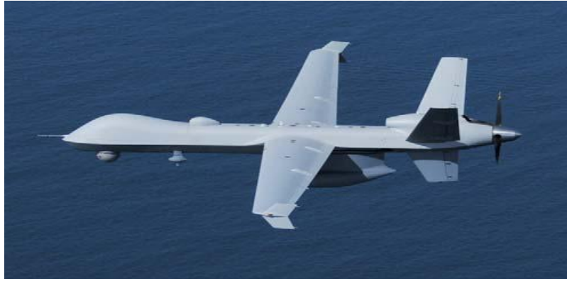
شكل(4)- MQ-9 Predator B unmanned aircraft

استخدمت أنظمة المراقبة باستخدام الطائرات بدون طيار (UAS) من قبل وحدة حماية الجمارك والحدود الأمريكية، (The U.S. Customs and Border Protection (CBP)، لحماية الاراضى والحدود الأمريكية، وتتبع المهربين والمتسللين عبر الحدود مع دول الجوار، كما استخدمت هذه الأنظمة في دراسة الأخطار المتوقعة التي تهدد امن البلاد من خلال عمليات تهريب المخدرات التي تندفق على الأرض الأمريكية بجزارة، وخاصة من الجزء الجنوبي الشرقي وخليج المكسيك، كما يوفر هذا النظام الاستطلاعى متابعة متطورة لحدود الدول في المناطق التي يصعب تغطيتها بواسطة العنصر البشرى والمعدات التقليدية وخاصة المناطق التي تمتد بها الصحراء إلى مساحات شاسعة ومهددة بشكل كبير من عمليات التهريب والتسلل كالمملكة العربية السعودية فى الشرق الأوسط وأيضا المناطق التي تحتوى على البحيرات والمستنقعات في رسم صورة واضحة للأنشطة والتحركات على تلك الحدود. (USCBP, 2011)