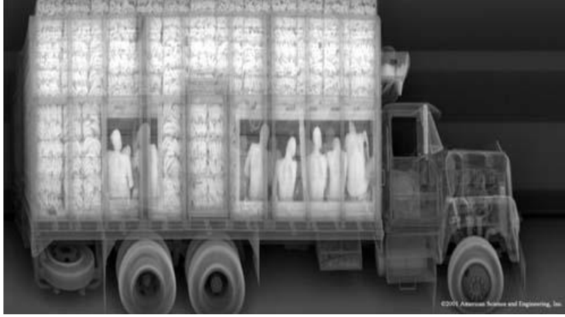
الشكل رقم (1) يوضح استخدام تكنولوجيا المسح الضوئي للكشف عن البضائع والمتسللين

تستخدم هذه الأجهزة للكشف عن المخدرات والقنابل والمتفجرات وهذه الأنظمة تختلف باختلاف طريقة الاكتشاف ولها أحجام مختلفة ففي المطارات والموانئ البحرية يستخدم الحجم الصغير للكشف عن حقائب وأمتعة الركاب وأطقم الطائرات والسفن والحجم الكبير للكشف عن الحاويات والسيارات وسيارات النقل . ( big future next 2007)